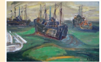
Hamburger Hafen, um 1915, Kunstmuseum Schwaan