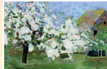
Obstbaumblüte, 1914, Kunstmuseum Schwaan