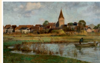
Stadtansicht von Schwaan, Kunstmuseum Schwaan