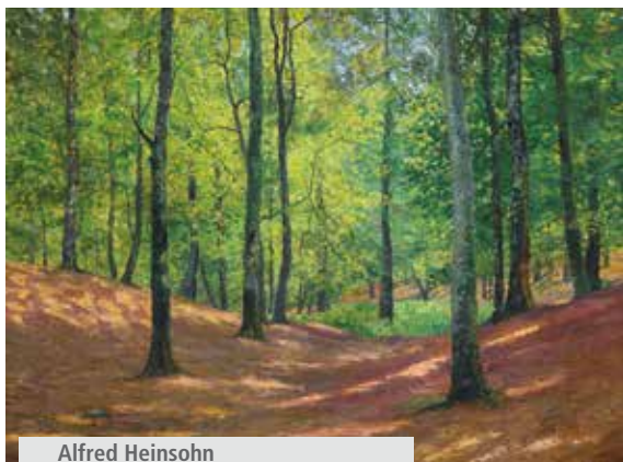
Alfred Heinsohn Der Lindenbruch bei Schwaan, 1898

Das Mühlenhaus entstand vor ca. 200 Jahren an dem Fluss Beke und ist eines der ältesten erhaltenen Profanbauten der Stadt. Die Balken- und Fachwerkstruktur der ehemaligen Mühle wurde behutsam in die Galerieräume integriert. Im Erdgeschoss ist ein historischer Mühlenraum eingerichtet.