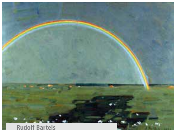
Rudolf Bartels Regenbogen, um 1924